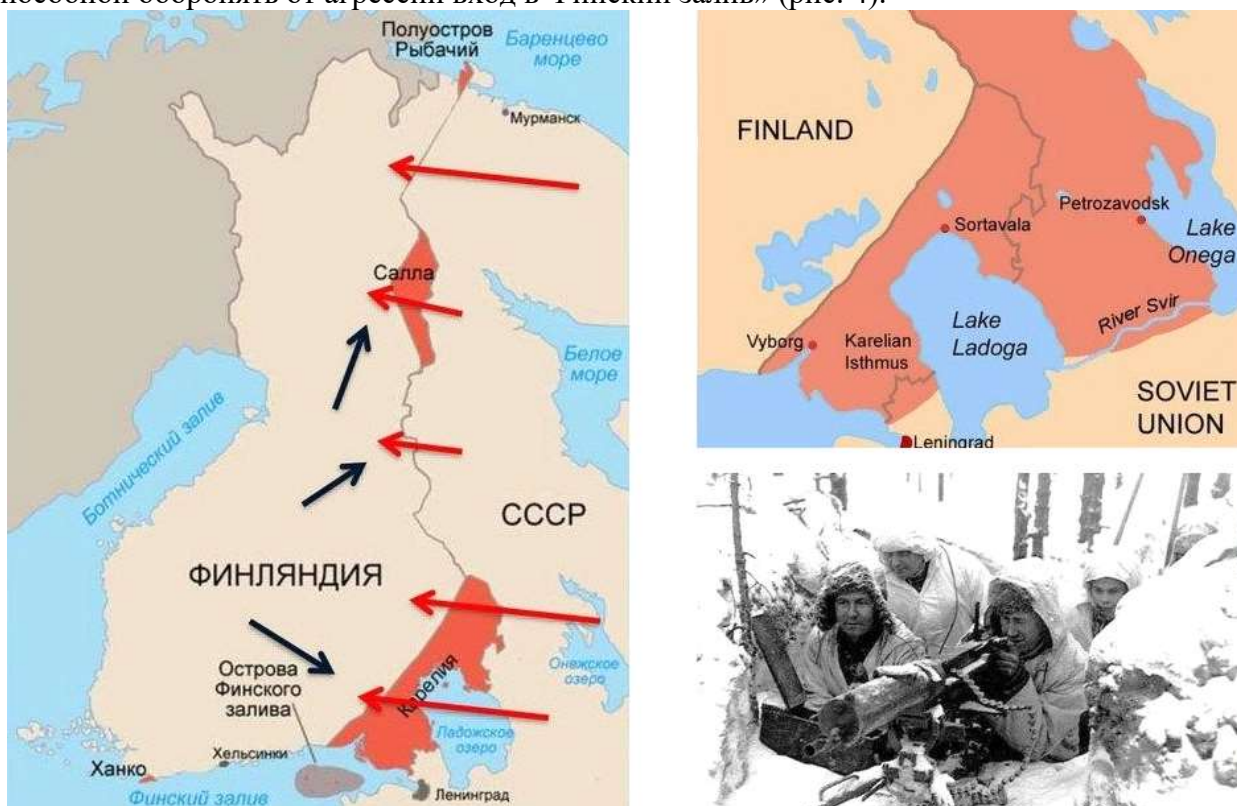
Рис. 4. Ноябрь

Карельский перешеек, западное и северное побережье Ладожского озера, ряд островов в Финском заливе. Советский Союз получил в аренду на 30 лет полуостров Ханко для создания на нём военно-морской базы, «способной оборонять от агрессии вход в Финский залив» (рис. 4).